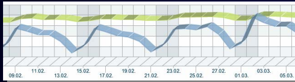
Typische Wochenanalyse Google-Traffic